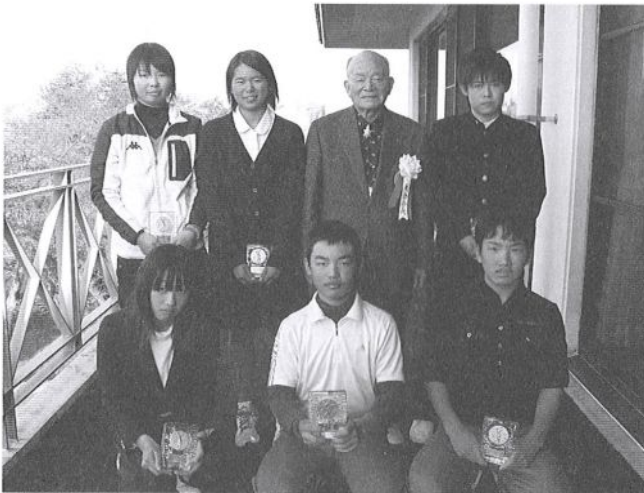
各部門のチャンピオン (中学生)

この大会は全国にも例のない四国独自の大会であり、その成績は四国地区指定強化選手選定の重要な検討資料となる。ラウンド終了後は簡単な体力測定を実施したり、保護者向けの講習会を開催するなど、新たな企画も開催されている。熱戦の結果、下表のとおり学年別のチャンピオン達が誕生した。