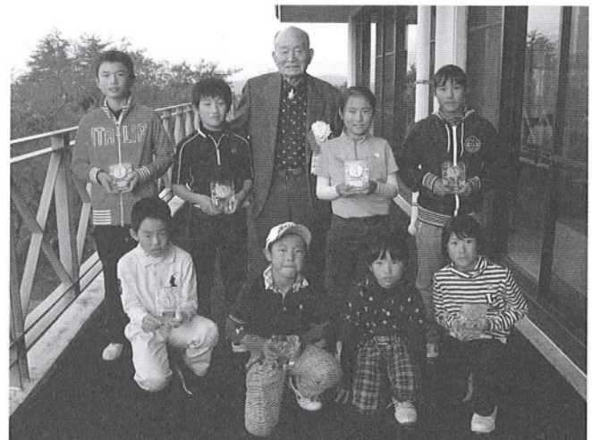
各部門のチャンピオン (小学生)