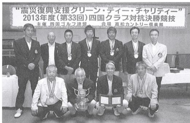
今治カントリー倶楽部関係者

第33回四国クラブ対抗決勝競技が8月8日、高松カントリー倶楽部で開催。県予選を勝ち抜いた20チームと開催クラブの合計21チームが参加。歴代最多優勝の今治CCが2位に12打差をつける圧勝でV9を達成。最多優勝記録を更新した。