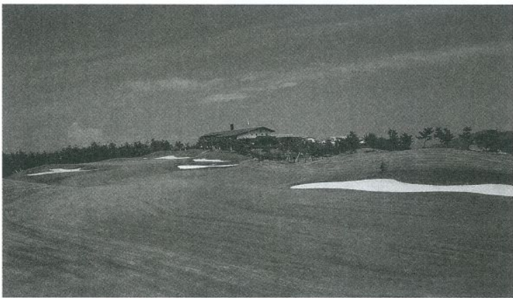
アウト9番ロング、クラブハウス目標のティーショットがポイント