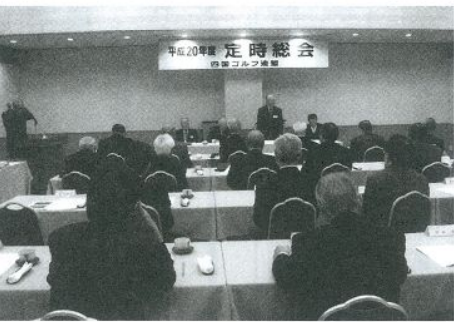
平成20年度定時総会

倶楽部の名譽をかけての唯の団体戦、第29回クラブ対抗決戦は8月7日、名門志度CCCで。今年も激戦が予想される。9、10月にかけてのシニア3競技は団塊世代の大量退職に伴うプレー