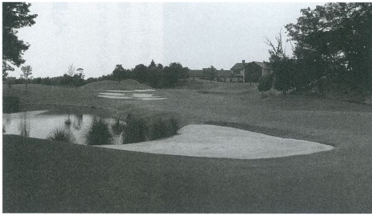
池とバンカーが待ちうけているアウト9番の第2打地点