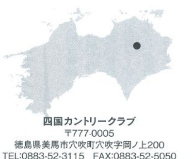
四国カントリークラブ 〒777-0005 徳島県美馬市穴吹町穴吹字岡ノ上200 TEL:0883-52-3115 FAX:0883-52-5050

高速道の完成で便利になりました。松山・高松・高知市からも時間から1時間半。当クラブで大自然とゴルフの醍醐味を満喫して下さい。