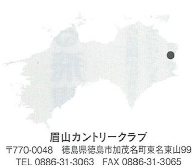
眉山カントリークラブ 徳島県徳島市加茂町東名東山99 TEL 0886-31-3063 FAX 0886-31-3065