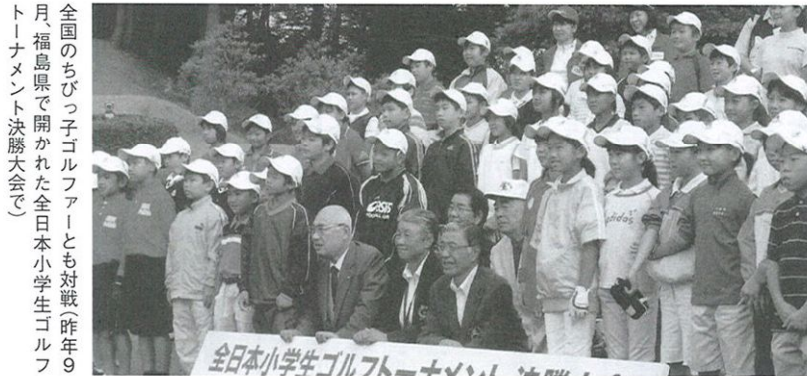
全国のちびっ子ゴルフファーストも対戦(昨年9月福島県で開かれた全日本小学生ゴルフトーナメント決勝大会で)