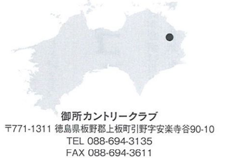
御所カントリークラブ 〒771-1311 徳島県板野郡上板町引野字安楽寺谷90-10 TEL 088-694-3135 FAX 088-694-3611

大型台風の影響です。それも続けて二個。忘れもしません、8月18日に5号、同22日に6号。暴風雨による被害は県内山間部に集中し土