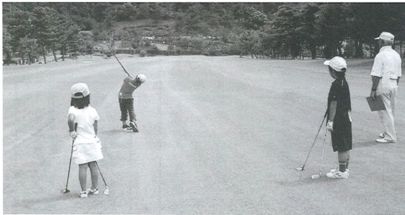
コースでのプレーは初めてのちびっ子も元気いっぱい(昨年8月、新居浜CCでの第一回四国小中学生大会で)