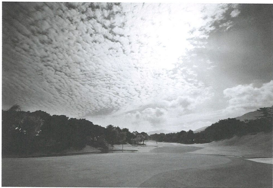
なだらかな打ちおろしのパー5で距離の出るプレーヤーは2オンも可能な9番ホール。ただし、グリーンの右サイドにある二つの池に入れないことが攻略の条件。

この年、注目の1年生プロはすでに26試合に出場して優勝4回、ベスト10入り16試合で獲得賞金額が1億円を突破しており、低迷続くゴルフ界の救世主的存在になっていた。