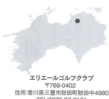
エリエールゴルフクラブ 〒769-0402 住所:香川県三豊市財田町財田中4980 TEL:0875-67-3131

昨年(第24回大会)は、姉妹コースのエリエールGC松山で開かれ(平成6年から財田と隔年開催)宮里が連覇した。特に最終日、後半3ホール