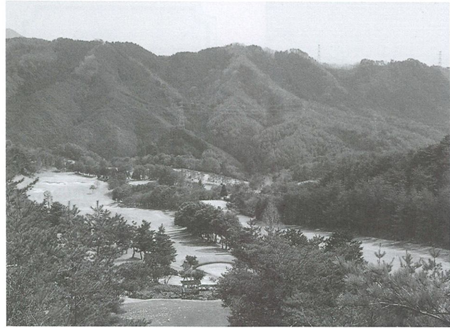
11番ロング(右)と17番ミドル(左)を区切る木々も大きく成長した。背後に連なる山々が四季の変化を楽しませてくれる

歩き遍路には高知は全く修業の連続である。一休何を考えて、何を思つて歩いているのだらうか。人間の幸福か世界の平和か、ひらすら仏を念じ