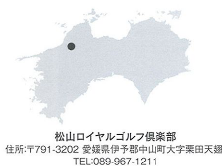
松山ロイヤルゴルフ倶楽部 住所:〒791-3202 愛媛県伊予郡中山町大字栗田天廻 TEL:089-967-1211