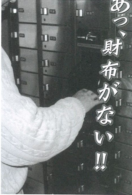
貴重品ボックスは安全のはずなのに...

久々の好スコア。ひと風呂浴びて帰り支度を終え貴重品ボックスの前立つ。鼻歌まじりに暗証番号を打ち込みボックスを開けてビックリ。