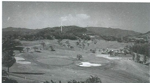
土佐山田CCの12番ショート、左側に太平洋が望める