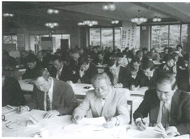
講義の後テストに挑む受講者たち (愛媛会場で)

四国ゴルフ連盟はこのほど加盟クラブの競技委員らを対象にした「ルールセミナー」を四県で順次開催した。