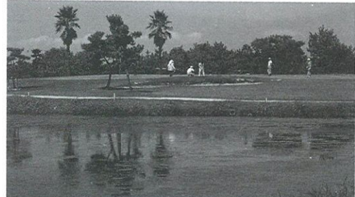
詫間CCの14番は池の絡んだ美しいミドルホール

ともあれ、人の出入りが自由なゴルフ場は、プロの窃盗犯にとって絶好の稼ぎ場なのだろう。ご用心ご用心。