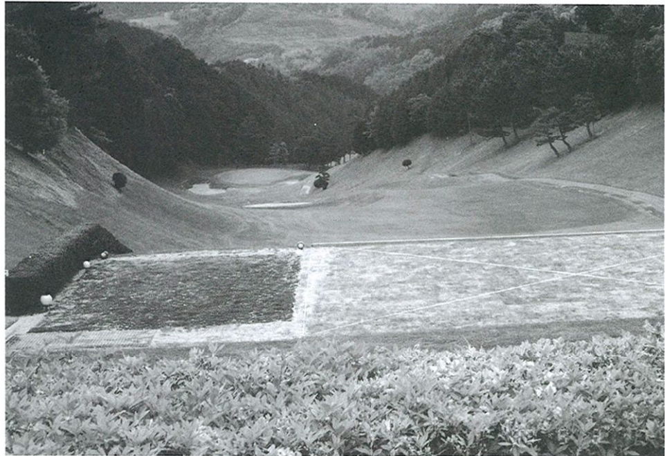
豪快に打ち下ろせるNo1のロング(482ヤード)だが、スタートホールだけにプレッシャーがかかる

(ちなみに今も市役所の正午のミュージックサイレンは「おはなはん」のメロディーが流れ、JR大洲駅前では彼女の銅像が観光客を出迎えている)