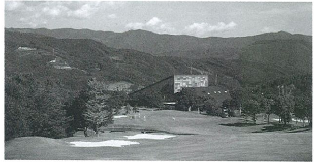
クラブハウスへ向かって打ち下ろす愛媛GCの18番ロング