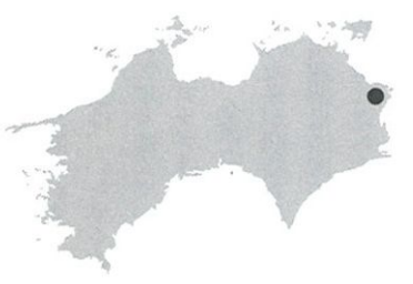
鳴門カントリークラブ 〒771-0364 鳴門市瀬戸町北泊529-1 TEL088-688-0111